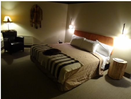
Une chambre © GP

On note que le lieu se complète d'un musée qui rappelle avec fierté les traditions Huron-Wendat, rend hommage à leur riche patrimoine, à leur goût de la forêt, source de mythes et légendes vivaces qui rappellent les origines des territoires bigarrés d'Amérique du Nord.