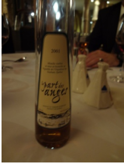
La part des anges

Là dessus, un blanc du domaine de l'Idylle, signé TOLLIER à Cruet, un morgon les Charmes de Gérard Buisson, un rouge québécois étonnant du domaine du lac Brome, enfin un Lavia, vin de Murcie en Espagne, issu de syrah et de monastrel, avant la Part des Anges, vin doux à 16,5 ° issu d'Estrie fait sur ces agapes de choix, des escortes choisies.