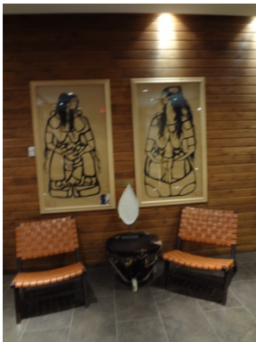
Dans le hall de l'hôtel

Là dessus, un blanc du domaine de l'Idylle, signé TOLLIER à Cruet, un morgon les Charmes de Gérard Buisson, un rouge québécois étonnant du domaine du lac Brome, enfin un Lavia, vin de Murcie en Espagne, issu de syrah et de monastrel, avant la Part des Anges, vin doux à 16,5 ° issu d'Estrie fait sur ces agapes de choix, des escortes choisies.