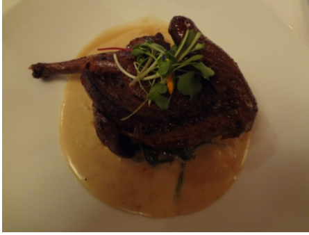
Qui roucoule dans la broussaille