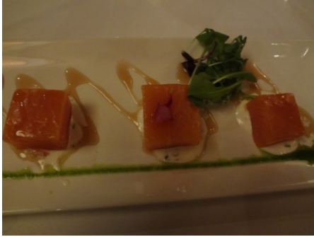
Face cachée de la mer