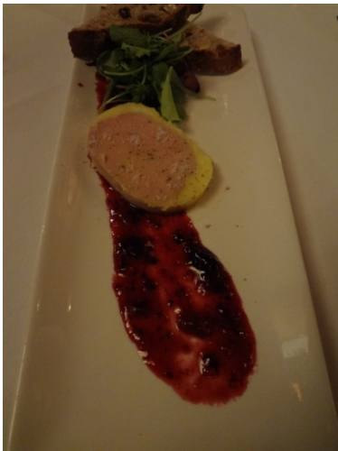
Que l'odeur des bois sature