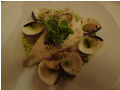
Doré aux palourdes

« Que l'odeur des bois sature », c'est une terrine de foie gras au torchon avec sa tartinade de camerise (cousine des airelles) avec son pain aux fruits secs (que l'on nomme « banique ») grillé. « Qui roucoule dans la broussaille » désigne un demi-pigeonneau rôti et laqué à la mélasse et sirop de bouleau, avec sa sauce aux quenouilles (des roseaux locaux).